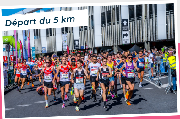
Départ du 5 km